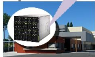
Salle des serveurs du collège

Accéder à mon document numérique depuis n'importe où (maison, collège...) à partir d'une connexion internet et/ou le rendre accessible à mes camarades d'îlot