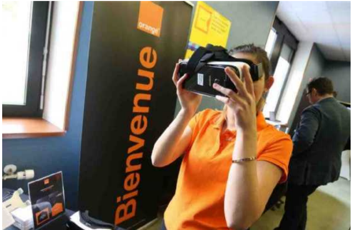
Orange présente ici un casque de réalité virtuelle couplé à un smartphone. L'intelligence artificielle devrait devenir plus prégnante dans le futur.

L'IA fera profondément évoluer le transport, la finance, mais aussi le marketing et la vente. Les envois de mails seront plus personnalisés, davantage en phase avec nos centres d'intérêt et par conséquent moins massifs, moins invasifs. Dans la logistique, l'automatisation des entrepôts permettra l'ultra-personnalisation de la chaîne. Dans le même esprit, j'ai vu au Consumer Electronic Show de Las Vegas une société chinoise propo-