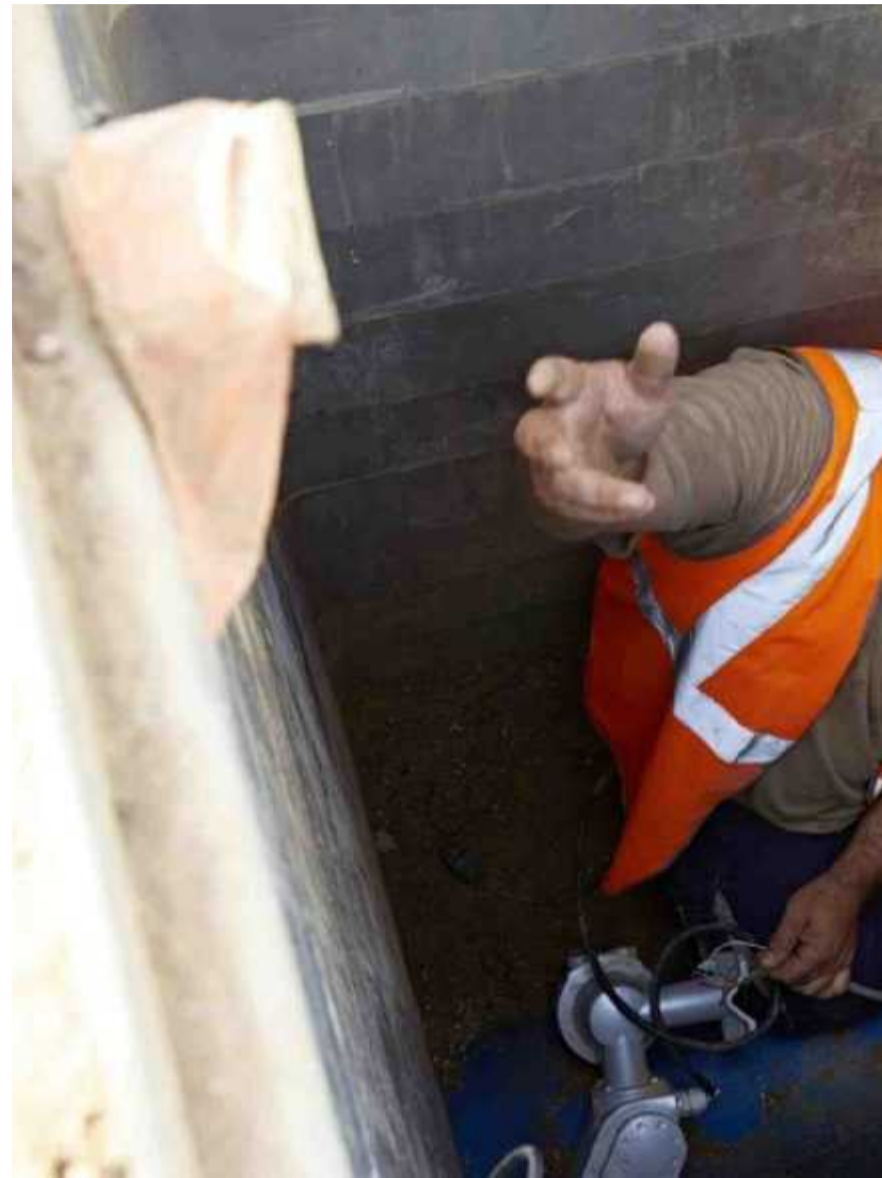
Combinée à l'expertise des hommes et des femmes du terrain, l'IA joue un rôle capital dans la maintenance des réseaux d'eau.

Les algorithmes de la société Fieldbox, spécialisée dans l'IA, ont été utilisés, ainsi que la flotte des drones de la société bordelaise Dronisos, capables de sillonner des kilomètres de canalisations enterrées. Ils embarquent des solutions de vision et de géolocalisation, analy-