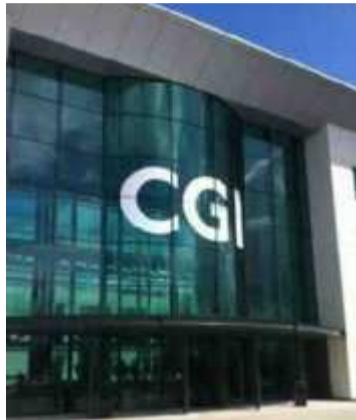
CGI emploie 74 000 salariés dans le monde.