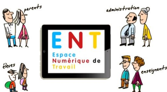
Les membres d'un ENT